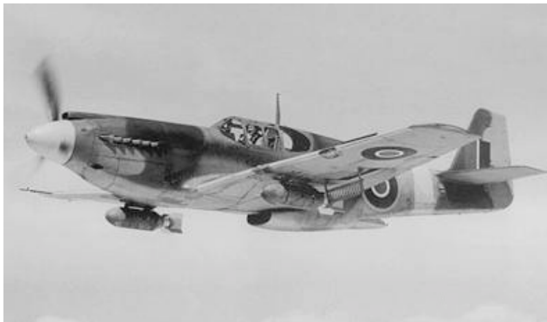
Mustang Mk 1

Cependant « North American » s'engagea à fournir cet avion 120 jours après la signature de la commande ! Il n'y eut que deux petits jours de retard.... Lorsque plus tard le moteur américain Allison fut remplacé par le Merlin Packard, l'avion devint un remarquable appareil avec un rayon d'action de 3328 km et une vitesse de 700 km/h à 7620m d'altitude.