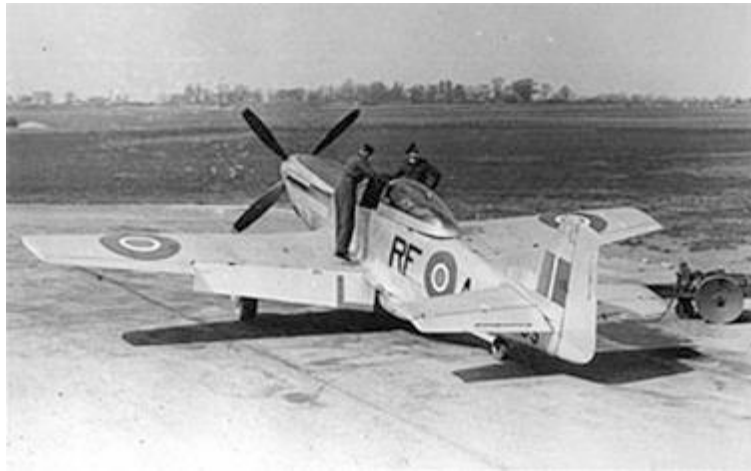
Mustang Mk IV .