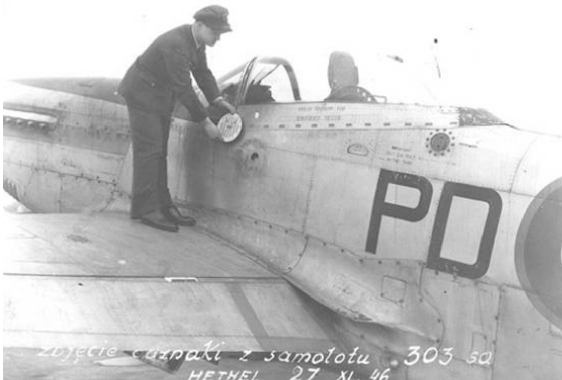
Un officier Polonais retire l'emblème du 303 de la carlingue signifiant ainsi la dissolution définitive de l'escadrille.....