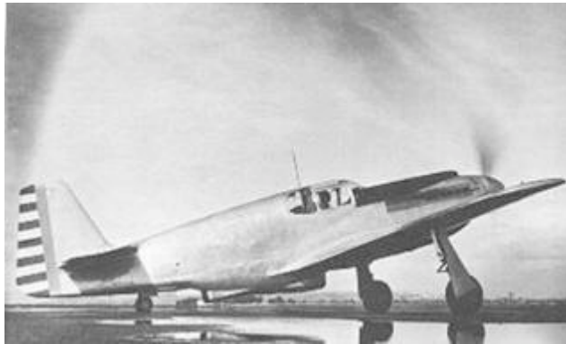
Le prototype du futur Mustang , le NA 37.

USA afin d'acquérir un appareil de chasse qui faisait défaut à la RAF. La « North American » proposa le chasseur NA.37 et les Britanniques en commandèrent 300 exemplaires de suite alors que l'avion était encore sur les tables à dessin des ingénieurs lesquels n'avaient alors jamais construits ni fait voler d'avions !