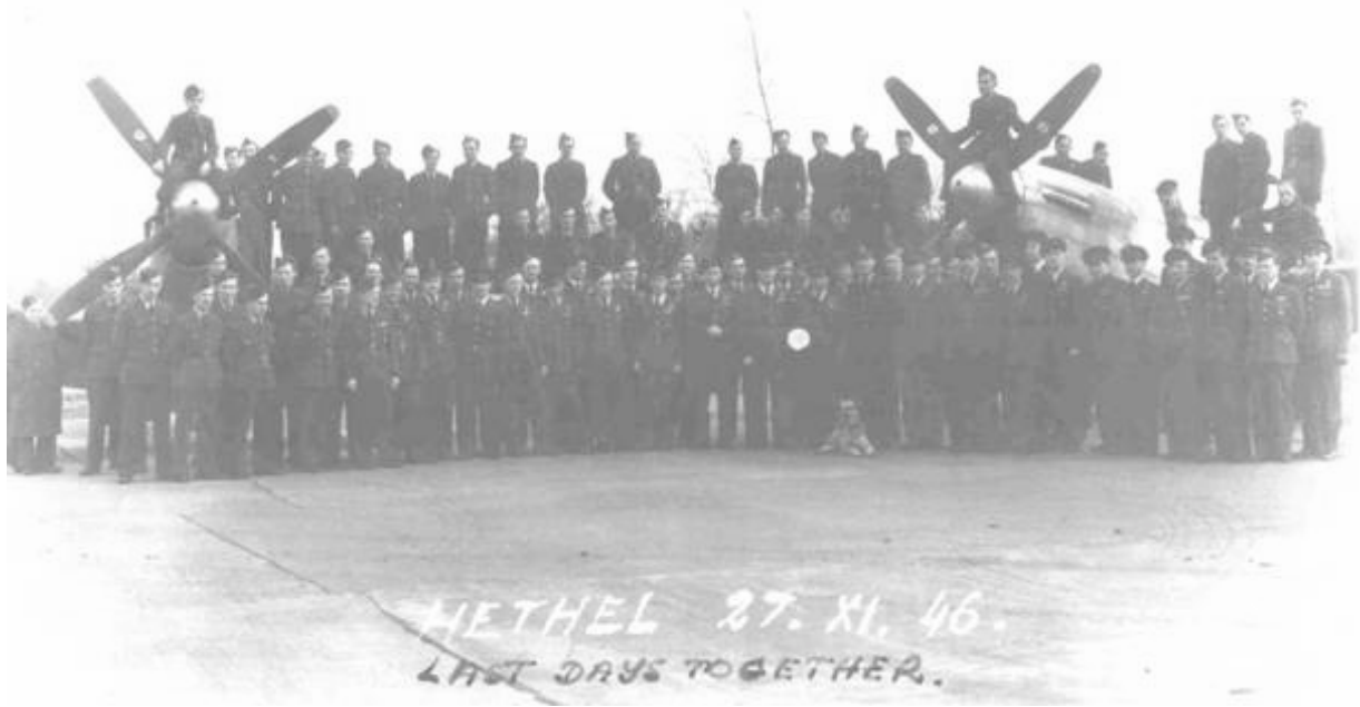
Le 303 à Hethel le 27 Novembre 1946 peu de temps avant sa dissolution !

Le 16/12/1946 le 303 était officiellement dissout.