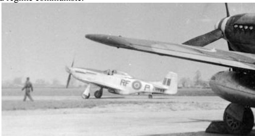
Hethel Mars 1946. Mustang IV RF-P KH866. (Au 1er plan un Mustang III du Sqn316)

Situé à quelques kilomètres au sud-ouest de Norwich, l'aérodrome fut construit en 1941 et pendant toute la durée de la guerre il a accueilli les bombardiers lourds de l'USAAF lesquels, dès la fin Mai 1945, étaient retournés aux USA. Le 23/3/1946 lorsque le 303 débarqua, il rejoignit le 316 toujours sur ses Mustangs III. En Octobre 1946 arrivent le 302 avec ses Spitfires XVI E en compagnie des 308 et 317 tous deux sur Spits XVI. Les pilotes de toutes ces escadrilles étaient polonais ou tchèques et regroupaient tous ceux qui étaient courageusement venus en aide aux Alliés pour éradiquer le nazisme. Mais la guerre touchant à sa fin, ils ne purent trouver le moyen de retourner dans leurs patries sous la dominance du régime communiste.